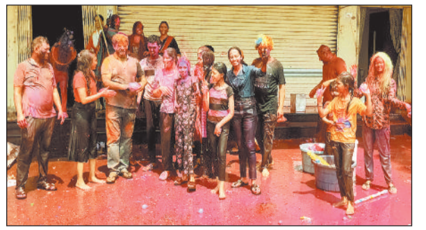
जमकर होली मनाते नागरिक। होली खेली व पुरानी बस्ती में डीजे के धुन में नाचते रहे। होली के रंग में रंगे लोगों ने बस स्टैंड के मंडी में जबरजस्त होली का माहौल बनाया। यहां डीजे की रंगभरी धुनों के संगीत में नाचते थिरकते लोगों ने नाच गाकर एक दूसरे को रंग लगाया। साथ ही एक दूसरे को रंग लगाकर होली की शुभकामनाएं देते रहे। वहीं होली के परम्परागत संगीत में नाचते लोग बड़ा भजिया और टमाटर की चटनी के साथ नास्ते का लुप्त उठाते रहे।

पथलगांव। नगर में लोगों ने खूब जमकर रंगों का त्यौहार होली मनाया। अपने परिवार के बड़े बुजुर्गों का आशीर्वाद लेने से लेकर अपने यार दोस्तों के साथ विभिन्न प्रकार के रंगों से रंगे लोगों ने होली के पारंपरिक त्यौहार को मनाई। इस मौके पर लोगों ने अपने सभी पुराने मित्र-शिकवे को भूलते हुए एक दूसरे को रंग लगाकर एक दूसरे को होली की बधाई देते देखे। सुबह से ही बच्चे से लेकर बड़े सभी रंगों से रंगे दिख रहे थे। बच्चे बड़ों को पिचकारियों से रंग मारते देखे तो बड़े भी प्यार से बच्चों के पिचकारी की मार से खुद को रंगते रहे। पानी से रंग लगा कर होली के त्यौहार में सभी ने एक दूसरे को रंग लिया। नगर में महिलाओं के साथ बच्चों ने भी जमकर