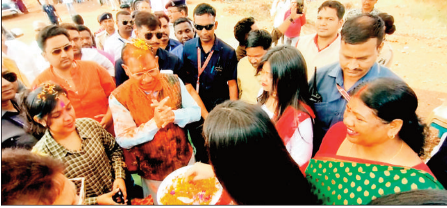
होली मिलन समारोह में शामिल मुख्यमंत्री विष्णु देव साय।

टिकैतगंज स्थित करमटोली के सरना निवास में आयोजित होली मिलन समारोह के दौरान छत्तीसगढ़ के मुख्यमंत्री विष्णुदेव साय मुख्य अतिथि शामिल हुए। मुख्यमंत्री साय ने यहां कार्यक्रमों को होली के पावन पर्व की बधाई व शुभकामनाएं देते राज्य के विकास एवं सुख शांति और समृद्धि की कामना की। समारोह के दौरान मुख्यमंत्री विष्णुदेव साय ने रंग गुलाल उड़ा कर कार्यक्रमों और पदाधिकारियों संग होली खेली। साथ ही पदाधिकारियों और कार्यक्रमों के मुख्यमंत्री को रंग गुलाल लगाकर होली खेली।