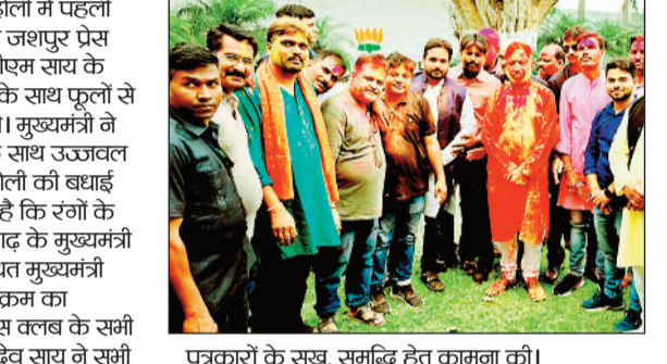
पत्रकारों के सुख, समृद्धि हेतु कामना की।

जशपुरनगर। सीएम बनने के बाद होली में पहली बार विष्णुदेव साय बगिया पहुंचे। यहां जशपुर प्रेस क्लब के सदस्यों पदाधिकारियों ने सीएम साय के साथ होली मनाई। रंग गुलाल अबीर के साथ पूलों से सीएम ने पत्रकारों के साथ होली खेली। मुख्यमंत्री ने यहां सभी पत्रकारों के सुख समृद्धि के साथ उज्ज्वल भविष्य की कामना करते हुए उन्हें होली की बधाई देकर मुंह मीठा करवाया। उल्लेखनीय है कि रंगों के महापर्व होली के अवसर पर छत्तीसगढ़ के मुख्यमंत्री विष्णुदेव साय ने गृह ग्राम बगिया स्थित मुख्यमंत्री आवास में होली मिलन समारोह कार्यक्रम का आयोजन रखा था। जिसमें जशपुर प्रेस क्लब के सभी पत्रकार आमंत्रित थे। मुख्यमंत्री विष्णुदेव साय ने सभी