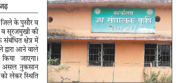
राजस्व अमलद्वारा आने वाले दिनों सर्वे किया जाएगा। जिसके बाद असल नुकसान व मुआवजा को लेकर स्थिति हो सकेगी।

बीते दिनों हुई बेमौसम बारिश के कारण जिले के पुसौर व धरमजयगढ़ विकासखंड में गेहूं, सरसों व सूरजमुखी की फसलों को नुकसान पहुंचा है। हालांकि संबंधित क्षेत्र में अपनी के संग होली के रंग में रंगे और क्षेत्र से आए सभी पदाधिकारी गण पत्रकार बंधुओं सहित क्षेत्र वासियों को होली की शुभकामनाएं दिये।