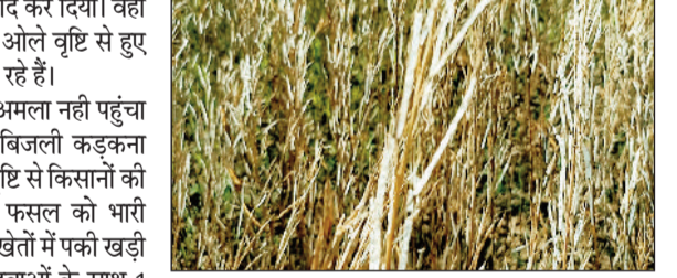
गेहूं गिरे। ओला वृष्टि से पूरा सरसों खेत सफेद आने लग गए। खेतों में ही पूरा सरसों का दाना झड़ के गिर गया और खराब हो गया। दूसरी तरफ कई गांवों में पेड़ धरासायी हो गए पूरा जन जीवन कुछ देरी के अस्त व्यस्त हो गया।

जशपुरनगर। जन सेवा अभेद आश्रम नारायणपुर के खेतों में लगे सरसों गिरे ओले ने पूरी तरह बर्बाद कर दिया। वहीं किसानों के गेहूं बर्बाद हो गया। किसान ओले वृष्टि से हुए नुकसान के लिए मुआवजा की मांग कर रहे हैं।